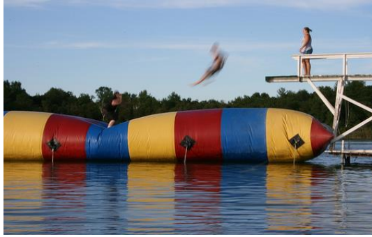
Εικόνα 3.1. Water Blob.