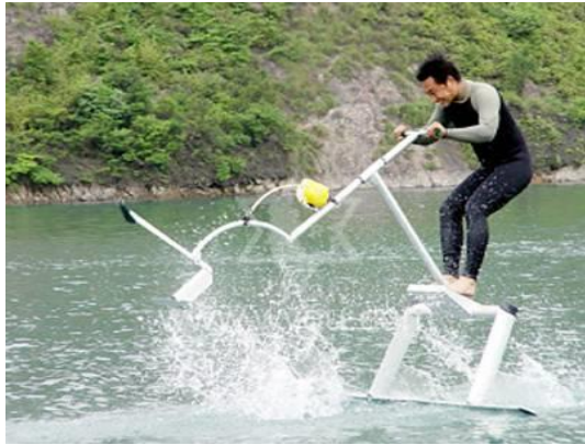
Εικόνα 3.2. Aquaskipper.