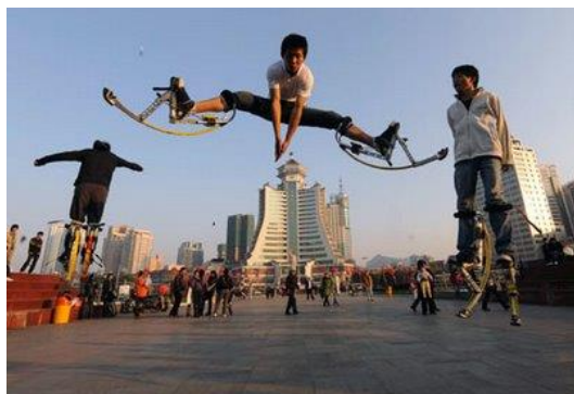
Εικόνα 3.5. Kangoo shoes.

Τα προαναφερθέντα προϊόντα παρέχονται από τους παρακάτω προμηθευτές, ενώ περαιτέρω πληροφορίες φαίνονται στο πίνακα 3.1.