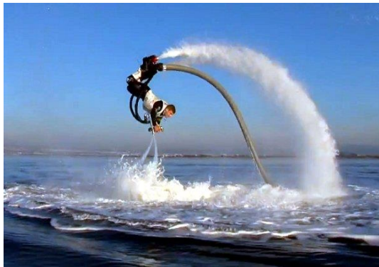
Εικόνα 3.3. Flyboard.