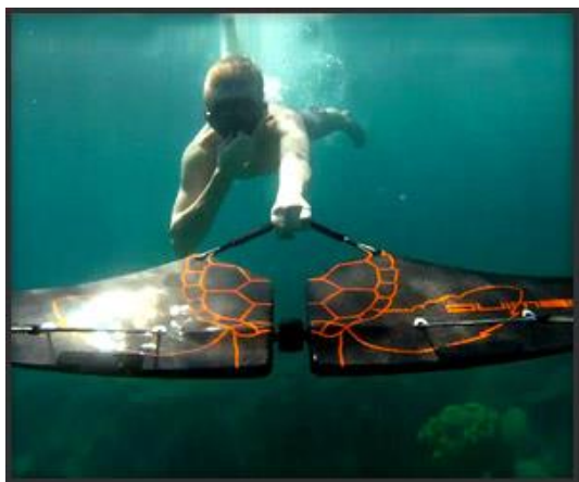
Εικόνα 3.4. Subwing.